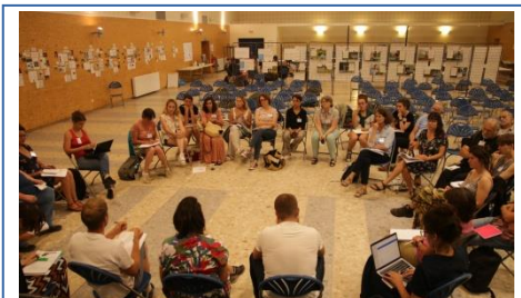
JN 2022 du RENETA en Bourgogne

Îlots paysans a poursuivi sa participation dans le réseau national des espaces test (RENETA). Les salariés sont investis comme animateurs du groupe de travail « ETA et Collectivités » et comme participants actifs à 2 commissions (commission compagnonnage et commission vie du réseau). L'association est présente au Conseil d'Administration du RENETA ainsi qu' au bureau . De plus, les salariés participent activement aux différents temps de rencontres du réseau, Rencontres de l'Equinoxe et Rencontres nationales.